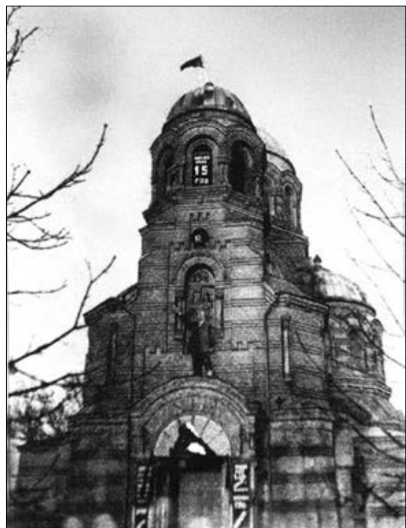
Минскую Казанскую церковь превратили в клуб железнодорожников. Фото 1933 года

«В Минск из Орла я возвратился во вторник 12 марта... О своем возвращении сделал заявление пятерке Скорбященской церкви с просьбой разрешить мне исполнять мои прежние обязанности настоятеля этой церкви... В первый раз богослужение я совершил в субботу вечером 17 марта. Никаких встреч и приветствий никто мне не устраивал. Я же сам обратился с приветствием к своим